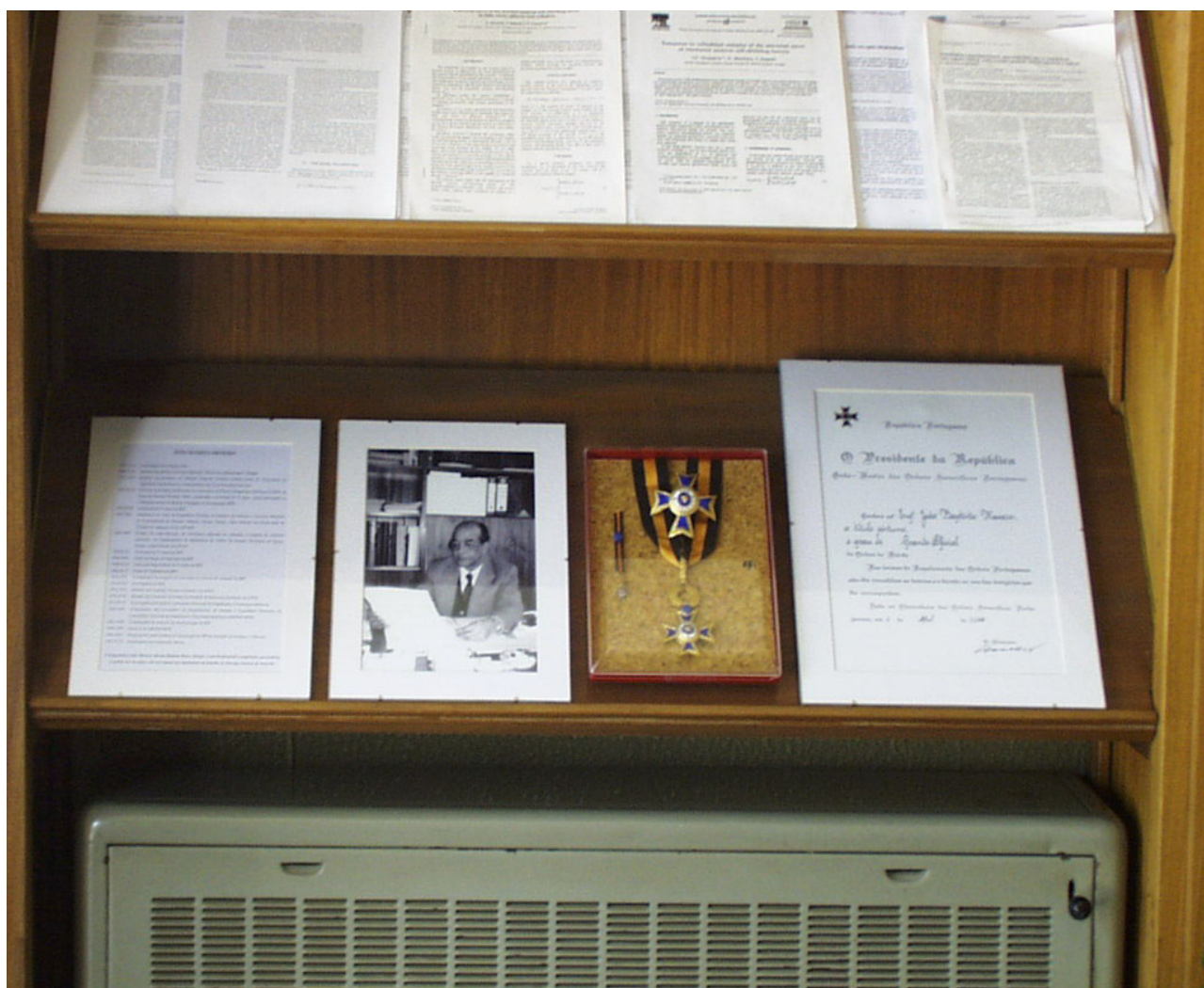
Diploma, condecoração, curriculum vitae e fotografia do Engenheiro Batista Menezes expostos no hall de entrada do edifício do R.P.I.