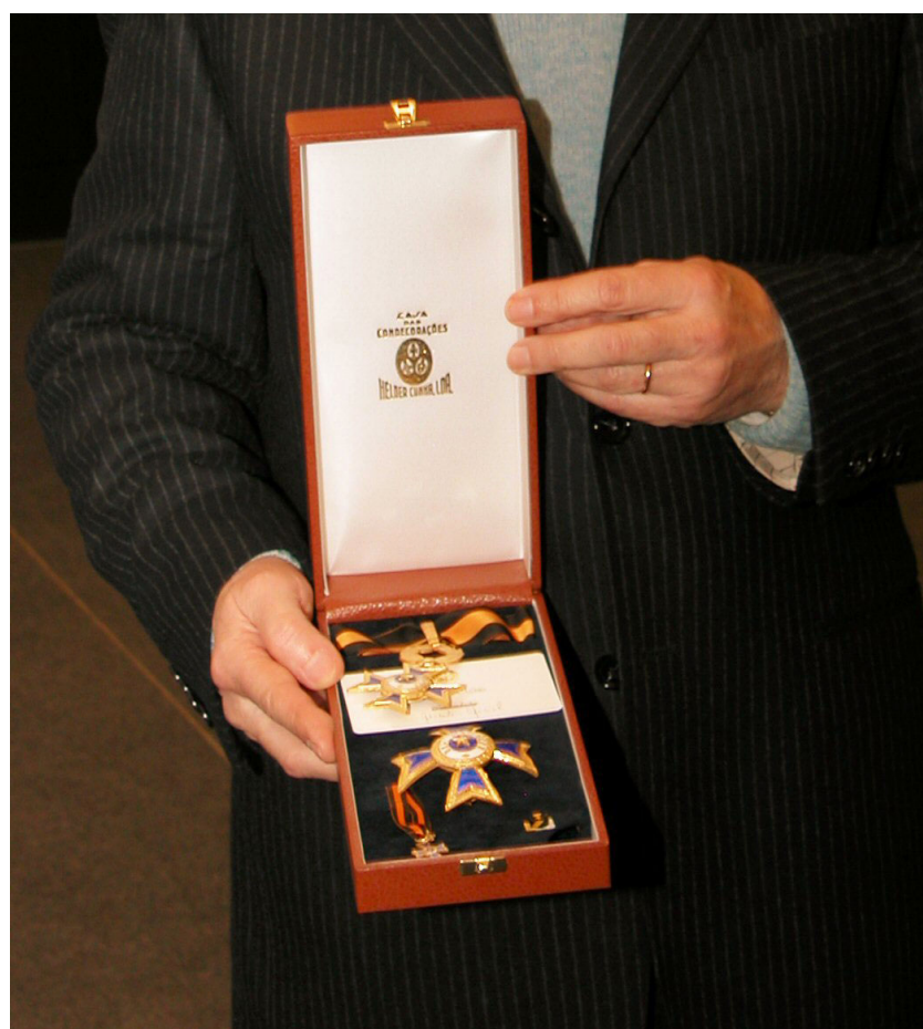
Distintivo e insígnia da Ordem do Mérito (grau de Grande Oficial).